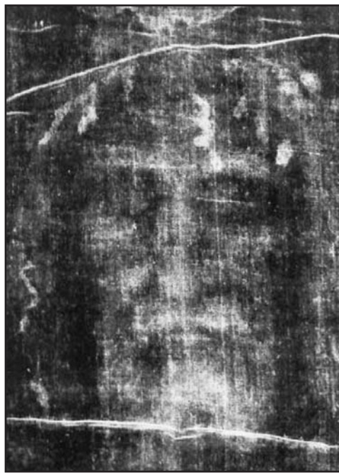
Il volto della Sindone.

Il Sacro Telo a quei tempi, forse per ragioni di spazio o per cautela, veniva mostrato ai fedeli piegato più volte dentro ad una cornice, in modo tale da fare risaltare solo il volto e non tutta l'immagine del corpo come nelle più recenti ostensioni. Nel 943 d.C., dalla città di Edessa viene nuovamente spostato a Costantinopoli, capitale dell'impero bizantino, quale prezioso acquisto dell'imperatore cristiano Costantino VII Porfirogenito, che dopo averlo recuperato ad altissimo prezzo, scongiurò il pericolo che finisse nelle mani degli infedeli arabi del califfato di Bagdad che precedentemente avevano occupato la città di Edessa.