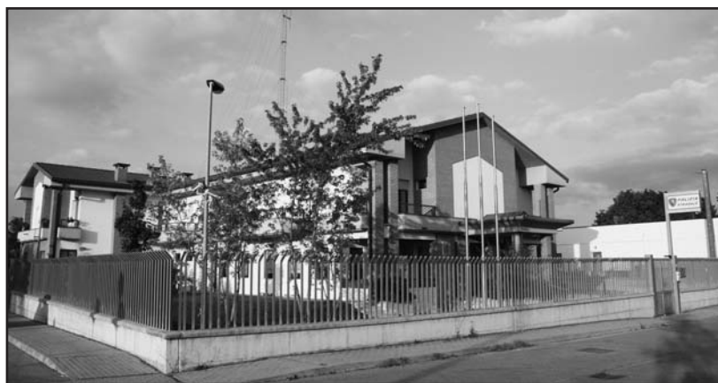
La nuova stazione di Polizia a Montichiari, costruita alla fine degli anni Novanta.