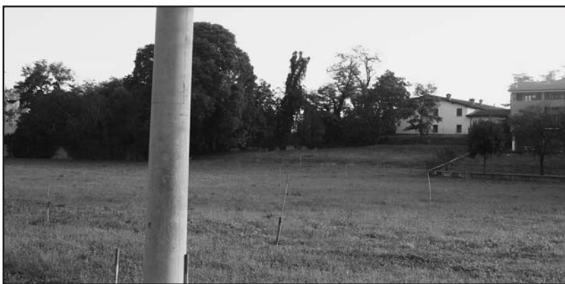
L'indicatore con i paletti del nuovo tracciato stradale.

Regna però un silenzio assoluto sul PGT (Piano governo del territorio) che ha già avuto una proroga di un anno, ma che a marzo