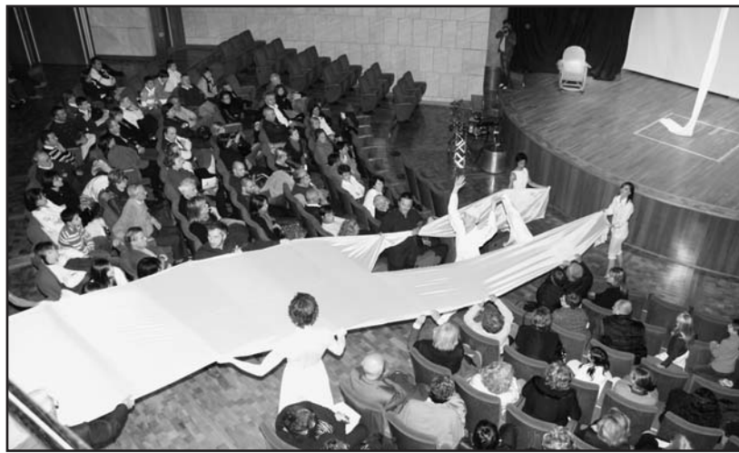
Una delle bellissime scene del coinvolgente spettacolo.